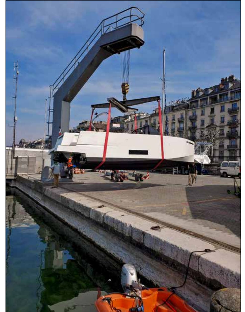
Hors de l'eau, le D33 Open révèle un profil très géométrique avec un décrochage inédit à la poupe afin d'intégrer les hors-bord.