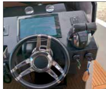
Le bateau d'occasion est équipé d'un traceur Raymarine et d'un propulseur d'étrave.